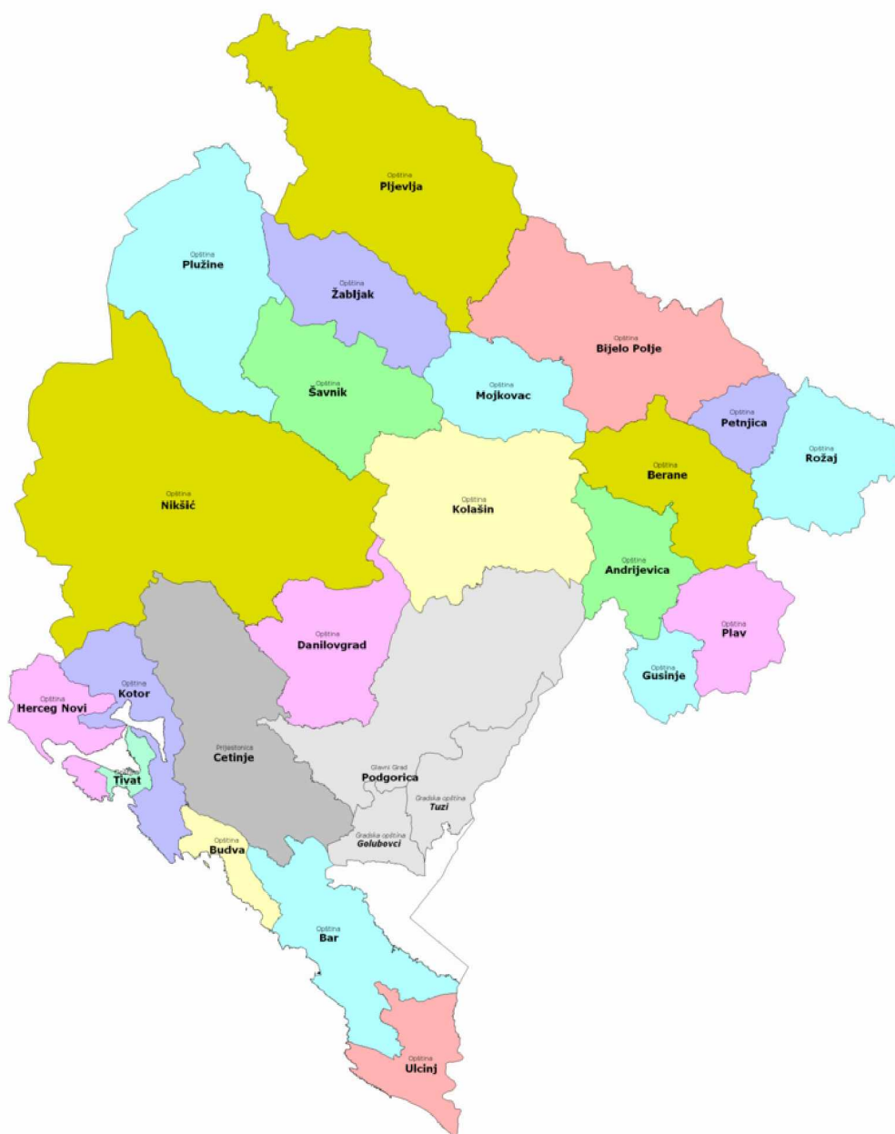
Slika 1. Opštine u Crnoj Gori

Glavni grad Crne Gore je Podgorica, a prijestonica Cetinje. Prema popisu iz 2011. godine populacija Crne Gore je iznosila 620.029 stanovnika, od čega su 50.61% žene, a