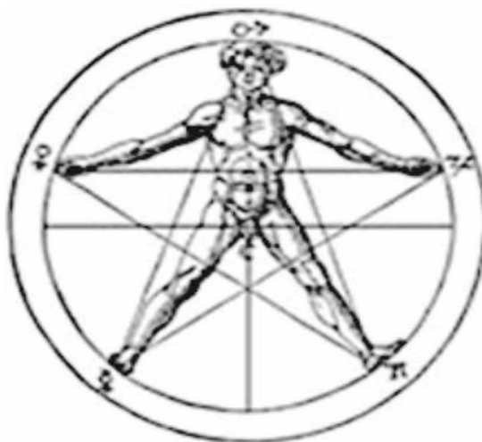
Slika 3. Staroegipatske mjerne jedinice

Prvi zapisi o dimenzijama čovjeka, o njegovoj građi i odnosima dijelova su zapravo zapisi koji predstavljaju skup nepisanih pravila, tj. kompozicijski zakon, po kojem su oblikovane slike i skulpture u egipatskoj umjetnosti. Kod uvođenja prvih mjernih jedinica stari Egipćani upotrebljavali su ljudsku ruku i šaku.